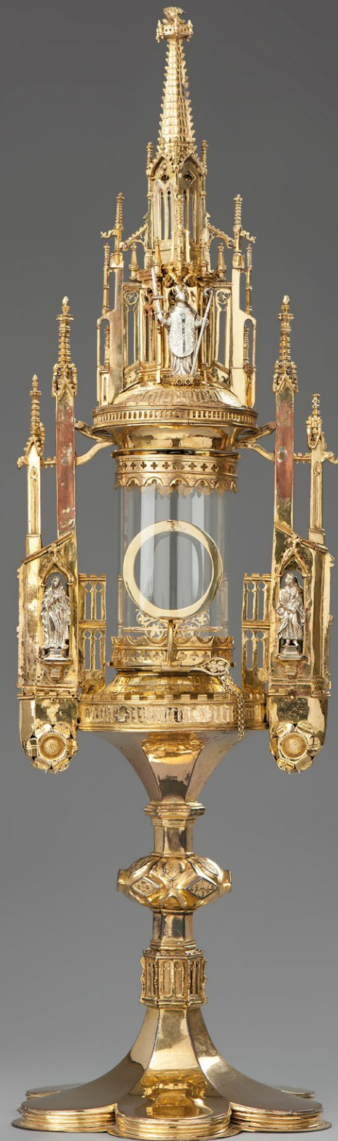
Turm-Monstranz um 1500

Stiftskammer in der Petrikapelle Stiftshof 2, 48231 Freckenhorst, Telefon: 02581 980077 www.stiftskammer-freckenhorst.de