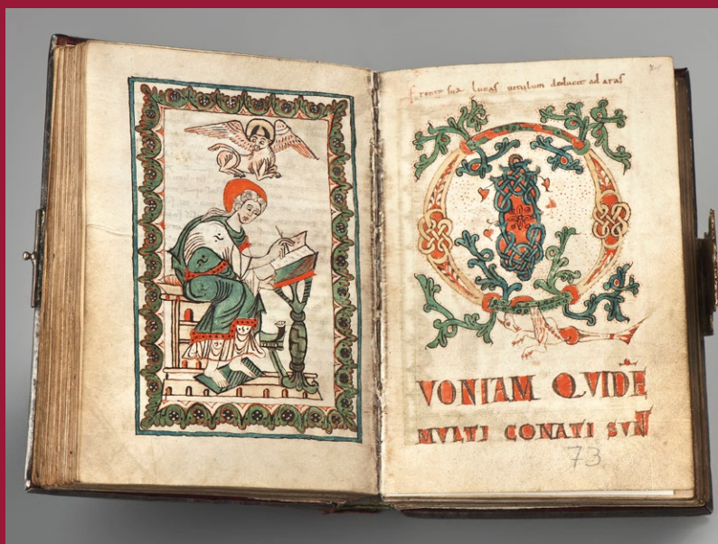
Emma-Evangeliar, 10./11. Jh.