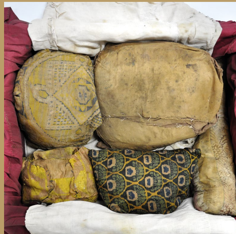
Blick in das Innere des Schreins der Hl. Thiatildis: Die Reliquien der Heiligen, einnäht in kostbare Seidenstoffe

reller Überlieferung. Jedes Exponat gewährt Einblicke in die Mentalität, das Wertgefüge und tägliche Leben der geistlichen Frauen, die seit dem Mittelalter hier lebten.