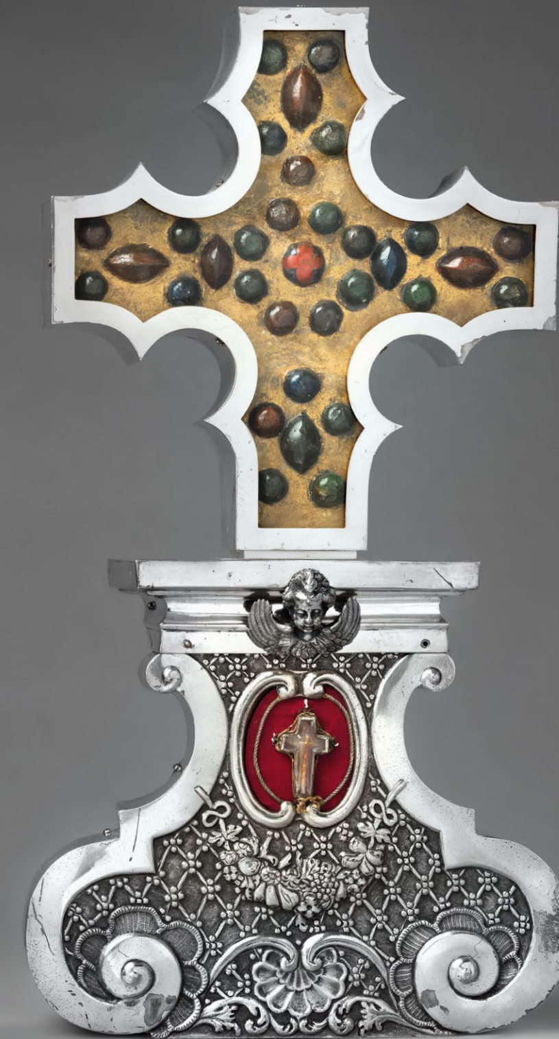
Das Freckenhorster Kreuz (in der Stiftskirche)

Bei der Gründung des Klosters um 855 n. Chr. durch den Adligen Everword machte dieser der Legende nach seine Nichte Thiatildis zur ersten Äbtissin der geistlichen Gemeinschaft. Thiatildis wurde in Freckenhorst, gerade wegen ihrer Sorge um die Armen, immer sehr verehrt. Nachdem auch in Freckenhorst im 16. Jahrhundert Ideen der Reformation Fuß gefasst hatten, bemühte sich im Zuge der Gegenreformation im 17. Jahrhundert besonders der münstersche Bischof Christoph Bernhard von Galen darum, eine wirksame und dauerhafte katholische Erneuerung des geistlichen Lebens auch in Freckenhorst durchzusetzen. Der Bischof knüpfte hierfür wohl bewusst auch an die Anfänge des geistlichen Lebens in Freckenhorst an, indem er