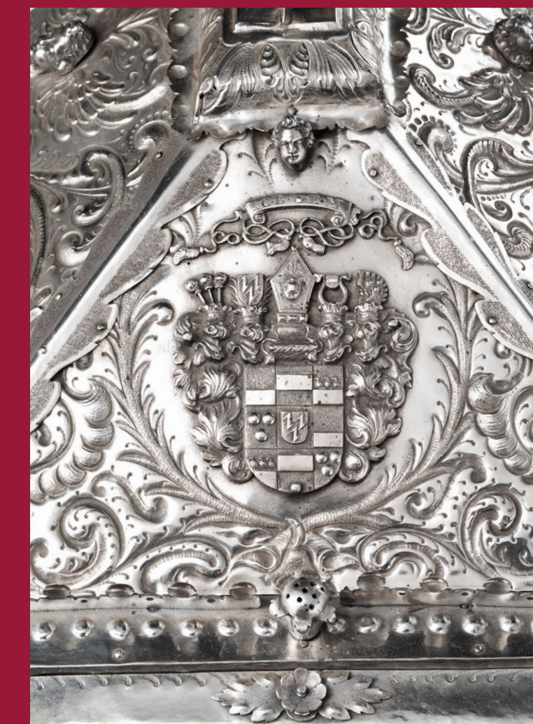
Das Wappen des Stifters auf dem Thiatildisschrein