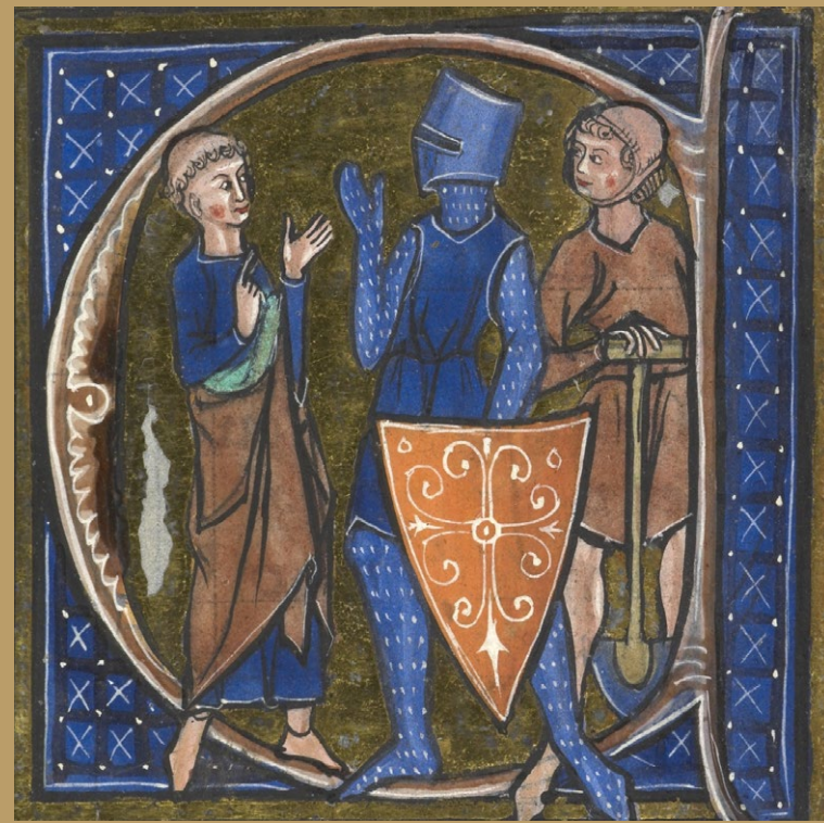
Kirche – Adel – Bauer, Buchminiatur mit symbolischer Darstellung der funktionalen Dreiteilung der mittelalterlichen Gesellschaft

bleiben sollte: An der Spitze der Gesellschaft sah Adalbero alle Geistlichen, da sie sich durch ihr stetiges Gebet um das ewige Seelenheil der Gläubigen sorgen sollten. Die Gruppe der Adligen, die als einzige im Mittelalter Waffen tragen durften, sah der Bischof in der Verpflichtung, die Gesellschaft als Ganzes zu beschützen. Den Bauern und Handwerkern kam die Aufgabe zu, durch ihrer Hände Arbeit die anderen beiden Gruppen zu ernähren und zu versorgen.