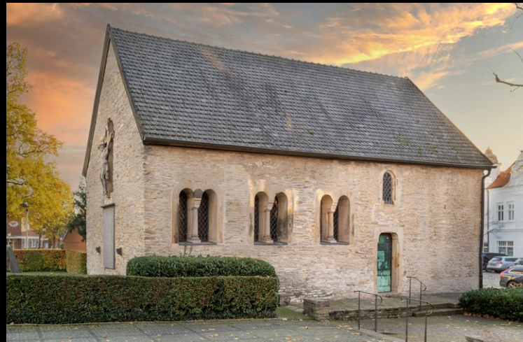
Die Petrikapelle ist eines der ältesten Bauwerke der Gesamtanlage des Stiftes Freckenhorst. Hier ist die Stiftskammer untergebracht.

Stiftskammer Petrikapelle Freckenhorst 2025 – In den Mittelpunkt gerückt: